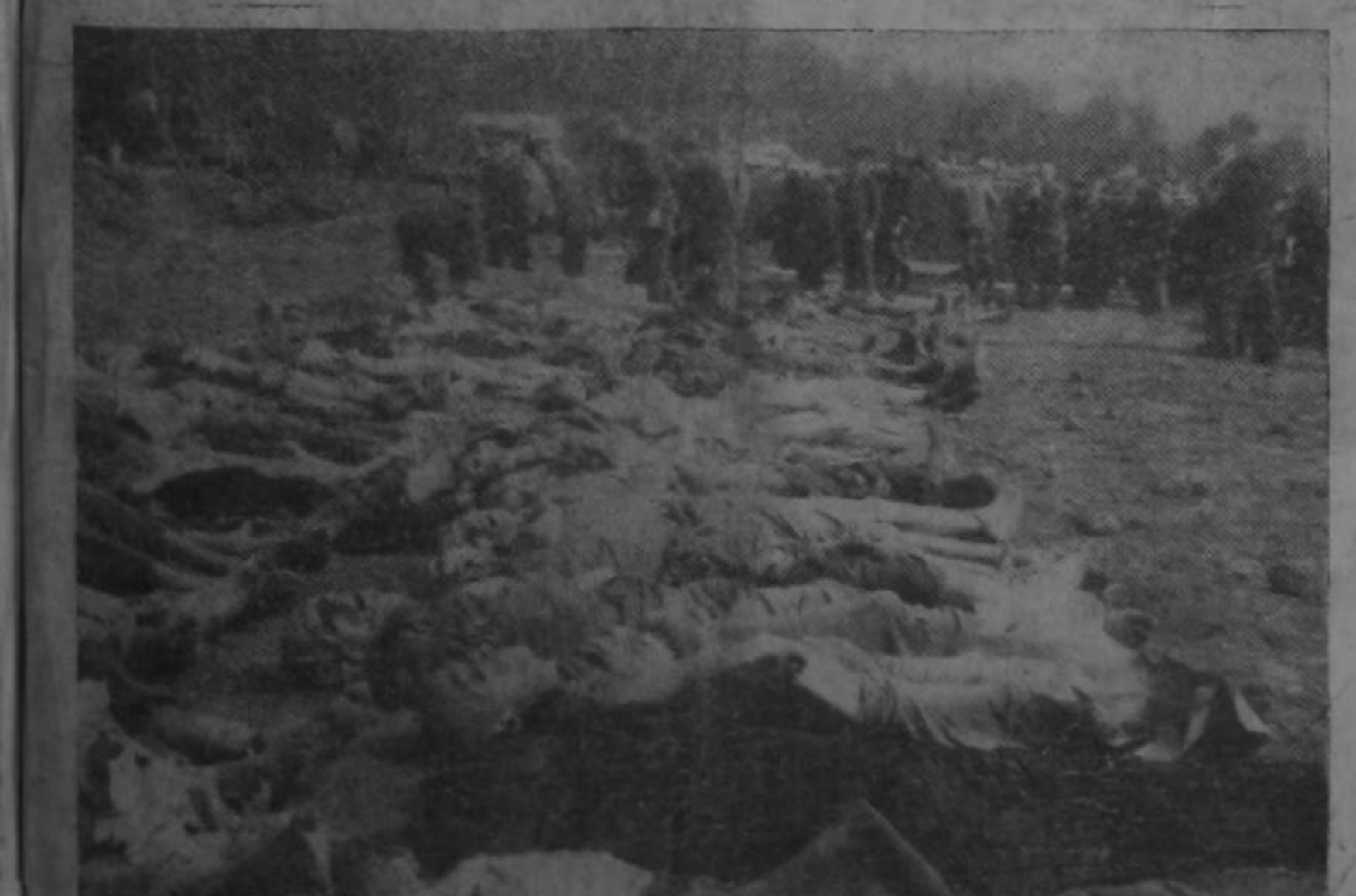
Alemanes civiles, vecinos de este campo de concentración han sido obligados por soldados de los Estados Unidos, a enterrar a sus víctimas. Casi todos estos civiles fingían ignorar los horrores cometidos en este campo y se presentaban como blancas e inocentes palomitas.

Se está comentando mucho por acá el hecho de que en Villa Quesada hay mucho nazismo. Aseguran que en Villa Quesada admiran todavía a Hitler; que en Villa Quesada alaban el valor de los nazis; que en Villa Quesada hay una gran influencia falangista. Nosotros estamos seguros de que esto no es cierto y hemos defendido ante las personas que aseguraban la veracidad de tales hechos, que no es posible que un grupo de esforzados habitantes como los de ese lugar, puedan simpatizar con las ideas y prácticas del nazismo basadas en el crimen. Nos dicen que esto se debe a la gran influencia de alemanes nazis en San Carlos y a la de cierto personaje español falangista, gran admirador de Franco que ha envenenado el ambiente de aquella región.