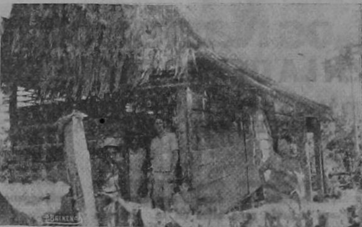
Un rancho de la Colonia Agrícola en San Miguel de Sarapiquí