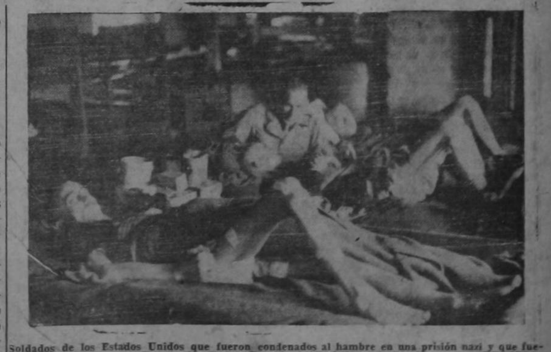
Soldados de los Estados Unidos que fueron condenados al hambre en una prisión nazi y que fueron convertidos en esqueletos a fuerza de privaciones y de mal trato. Fueron hechos prisioneros en diciembre del año pasado y en seis meses los nazis los convirtieron en esqueletos vivientes a fuerza de privaciones y de mal trato.

Fero todo el veneno de dicho personaje y al que hayan podido regar los alemanes nazis establecidos en la región de San Carlos, tiene que haber resbalado—sin dañarlo—sobre la hombría de bien y la integridad de los sancharleños. Los sancharleños no pueden estar con los que han defraudado a los adolescentes y a los niños de su país, hasta convertirlos en monstruos a los que han ejercitado en comer carne humana. Los sancharleños no pueden estar con los que han inventado los horrores de los campos de concentración, verdaderos infiernos en los que se bañaba a los prisioneros en líquidos combustibles y luego se les prendió fuego; en los que se prostituyó a las mujeres y a los niños con la mayor sangre fría. (Pasa a la pág. 4)